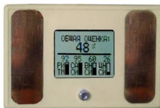
화면. 장치 "리더그래프"

설명합니다. 이것은 운동 선수의 운동 특성에 대한 올바른 기능적 연구를 기반으로 할 수 있습니다. 전문가가 개발 한 권장 사항을 통해 단일 방법론에 따라 성공적인 선수를 준비 할 수 있습니다.