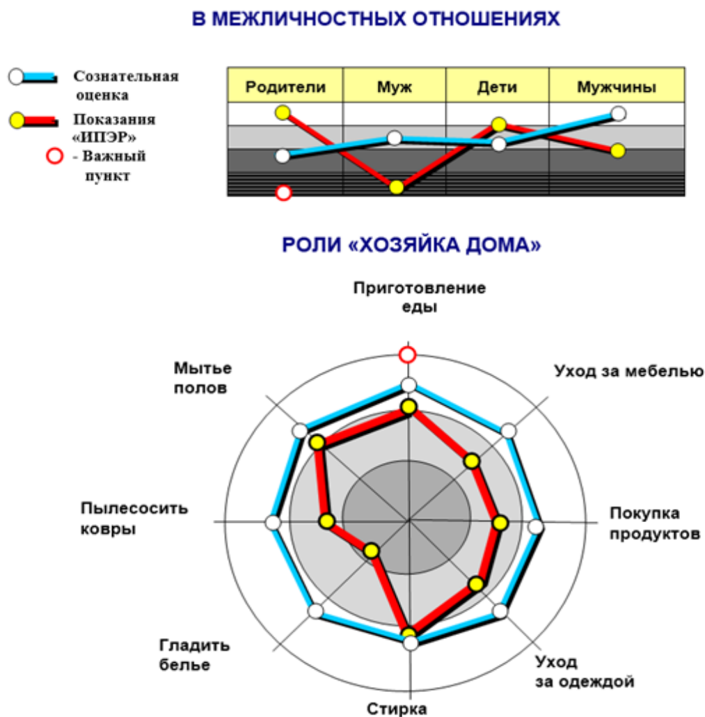
Рис. 2 Уровни психоэмоциональной напряженности

Психосемантическая диагностика БОС с использованием АПК «ИПЭР®-1К» призвана расширить границы самопознания женщины, ее способности воспринимать мир шире и на этой основе видеть большее число вариантов поведения в той или иной ситуации. Женщина, которая учитывает игровые