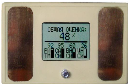
Рис.1 прибор «Ритмограф»

В исследовании спортсмен проходил первоначальную диагностику на приборе «Ритмограф» (Рис.1), после чего ему в течение 30 минут проводили психологическую коррекцию с использованием АПК «ИПЭР-1К» (Рис.2).